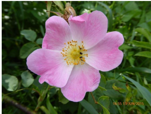
Rosa sherardii – Samt-Rose

Über eine zahlreiche Teilnahme würden wir uns sehr freuen.